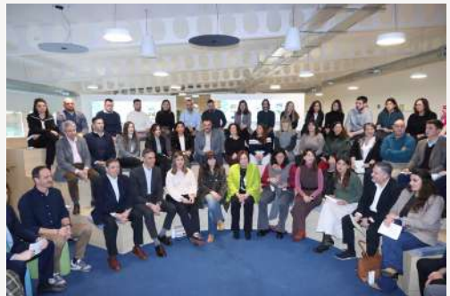
Jornada "Jóvenes y Actividad Agraria" donde el MAPA impulsó la creación de una plataforma estatal de tierras públicas para facilitar el relevo generacional.

Desde UPA consideramos que es un paso en la dirección correcta, pero es necesario avanzar hacia un relevo generacional ambicioso, con ayudas para quienes se incorporan y reconocimiento para quienes ceden sus explotaciones.