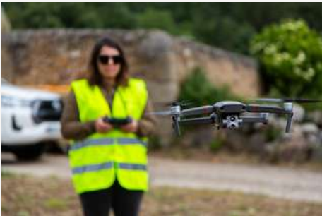
Formación en pilotaje de drones para agricultura de precisión.

Es evidente que nuestros jóvenes están cada vez más formados, concretamente aquellos que se vinculan a la tierra. Estos desafíos nos obligan a intervenir en el sector primario para fomentar un modelo de agricultura basado en las personas y en su vinculación con el territorio, así como a incrementar los instrumentos que ayuden al relevo generacional y aseguren el futuro del campo.