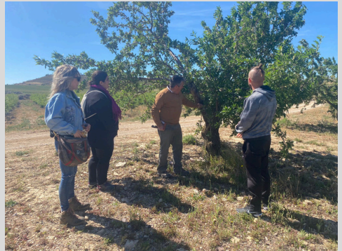
Foto 2. Los tres jóvenes en la explotación en Ainzón

Un año más UPA Aragón participa en el programa Cultiva , una iniciativa financiada por el Ministerio de Agricultura, Pesca y Alimentación, en la cual jóvenes de todo el país visitan explotaciones modélicas de otras partes del territorio para formarse y adquirir conocimientos que podrán aplicar en su explotación. En estas estancias formativas de cinco días, los jóvenes tienen todos los gastos cubiertos e incluso disponen de un importe para que alguien les cuide la explotación en su ausencia.