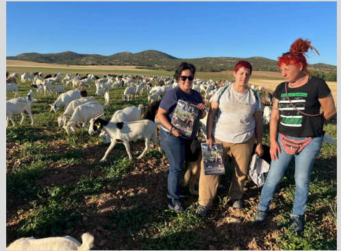
Foto 5. Visita complementaria a otra explotación caprina.

muchas salidas a campo para formación práctica, las cuales se complementaron con la visita a las oficinas de UPA Aragón en Calamocha y otra visita a la una explotación de caprino en extensivo para poder comparar entre diferentes modelos de gestión.