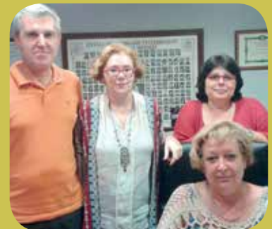
MST ASESORES S.C.P.

Módulos, estimación directa o Sociedades y los modelos que realizan son los siguientes: Preparación de las declaraciones del IVA Resumen anual (303, 390); Declaración de ingresos y pagos superiores a 3.005,06 € (347); Modelo de pago a cuenta del Impuesto de Sociedades (202); Declaraciones del Impuesto de Sociedades (201) conforme a facturas y documentación recibida; Declaración de retenciones arrendamientos (115, 180); Informes: Cuenta de explotación, Balance de situación, Libro diario y mayor; Sumas y saldos, Libro de IVA, Resumen facturas recibidas y emitidas; Cuentas anuales y presentación telemática de las declaraciones.